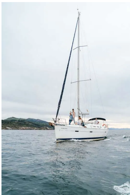
Turismo de Guipúzcoa

¿Os imagináis un plan que combine en menos de dos horas un delicioso pescado fresco a la parrilla en la costa y una inmersión en la cultura del vino txakoli, en Getaria ? En 'Souvenirs from Gipuzkoa' , la caja Aizkorri os invita a vivirlo. La empresa local viajes Equinoccio se encargará de pulir todos los detalles. Además, también podrás visitar en Getaria , la cuna de la D.O. de Txacoli, repleta de bodegas familiares, con un tour privado que recala en la encantadora villa turística de Zarautz y después Zumaia , a orillas del mar y a tiro de piedra del Geoparque .