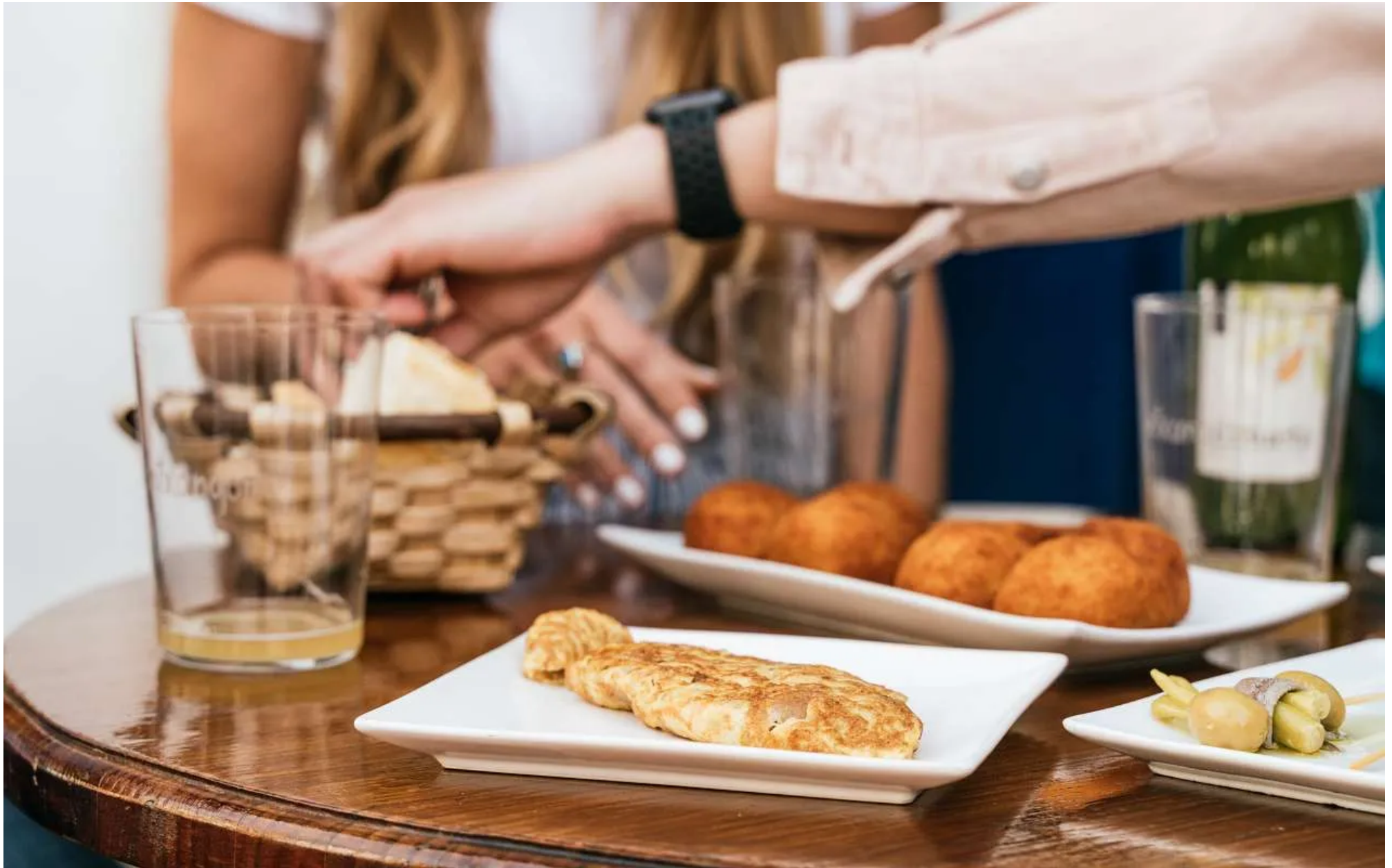
Turismo de Guipúzcoa