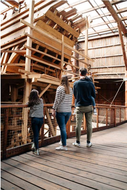
Turismo de Guipúzcoa

la belleza de la costa de esta ciudad marinera desde otro ángulo. Un paseo de esos, con la brisa en el rostro, que recordaréis para siempre.