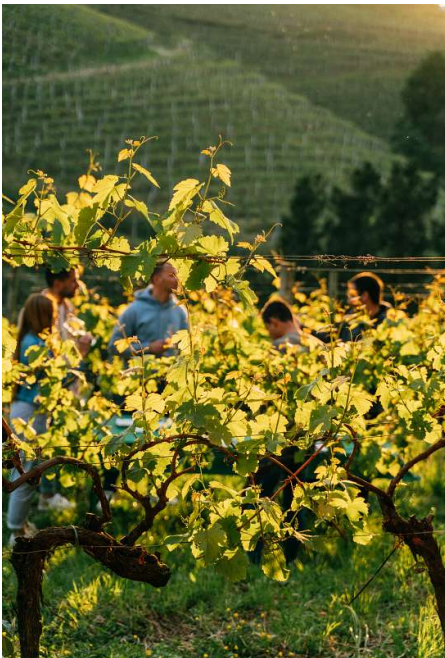
Turismo de Guipúzcoa