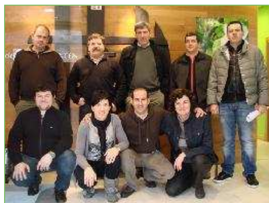
GIPUZKOAKO SAGARDOGILEEN ELKARTEA