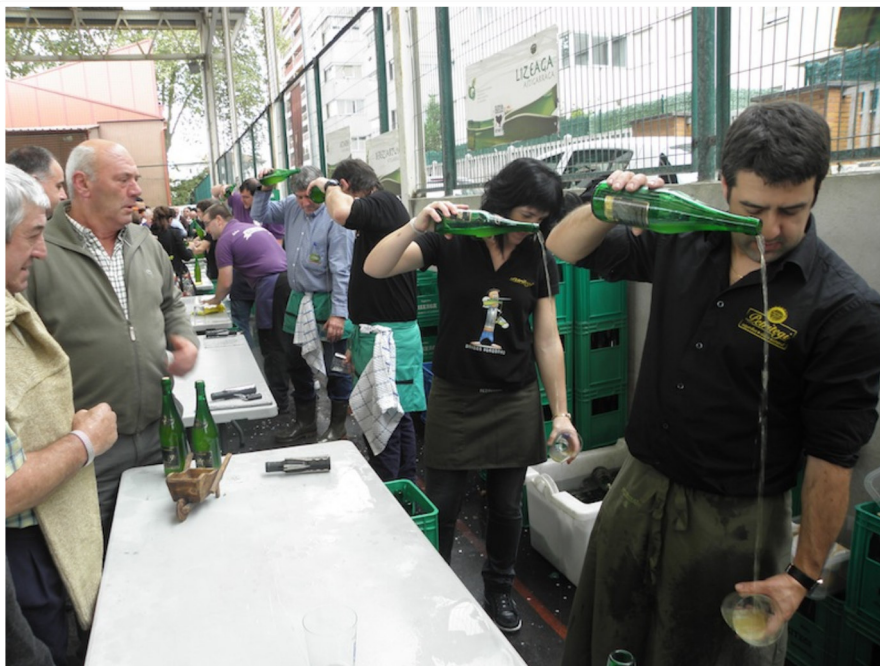
Sagardoa edateko parada izan da goizean Arantzazuko Ama ikastolaren jolastokian.

Zilindro-kopa (125 kilo), Kubikoa (112,5 kilo) eta Bola (100 kilo) harriekin egindako hiru minutuko txandetan.