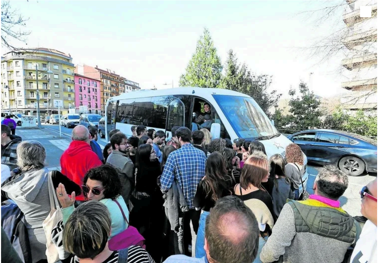
Un grupo de visitantes espera para subirse a un autobús durante la pasada temporada de sidrerías. Gorka Estrada

Hernani analiza la viabilidad jurídica de limitar el número de buses en el municipio los sábados en los que recibe llegadas masivas de visitantes