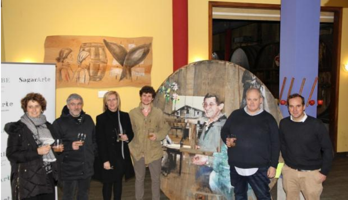
Sei ostatuak parte hartzen dute proiektuan; argazkian, 'Herri ostatuak'-en aurkezpenean.

Gure herrian bi topaketa aurrera eramango dira: martxoaren 25ean Santa Lutziko Topa tabernan eta apirilaren 1ean herrigunean dagoen Argindegi ostatuan