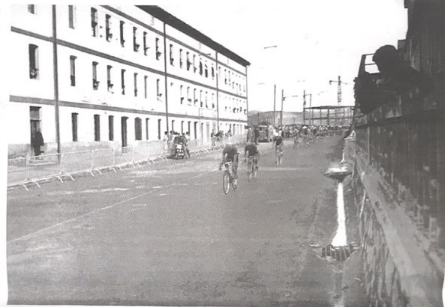
El Campeonato del Mundo de Ciclismo de 1965 pasó delante de la casa Zelaialde, en cuya planta baja estaba la sidrería.