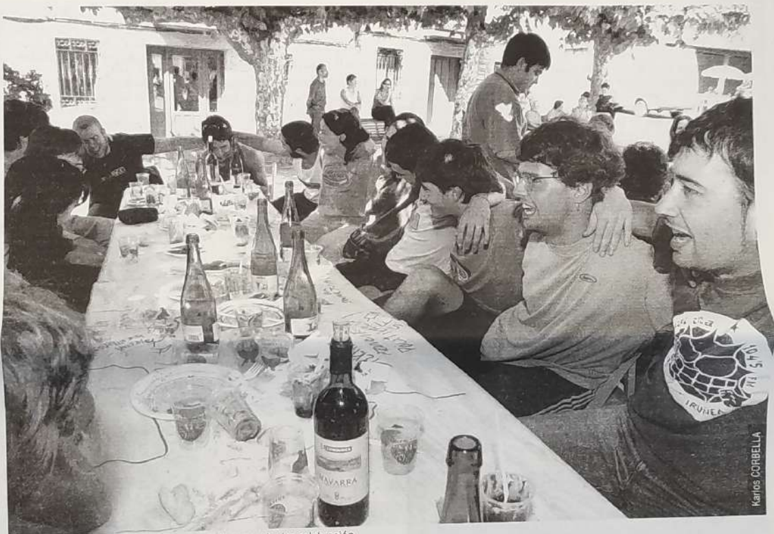
La sidra está haciéndose un espacio propio en cualquier celebración.

Hernani, Astigarraga y Orereta, junto a otras localidades de la zona sidrera, conocen desde hace años un auge creciente de la sidra en el poteo, algo que se está ex-