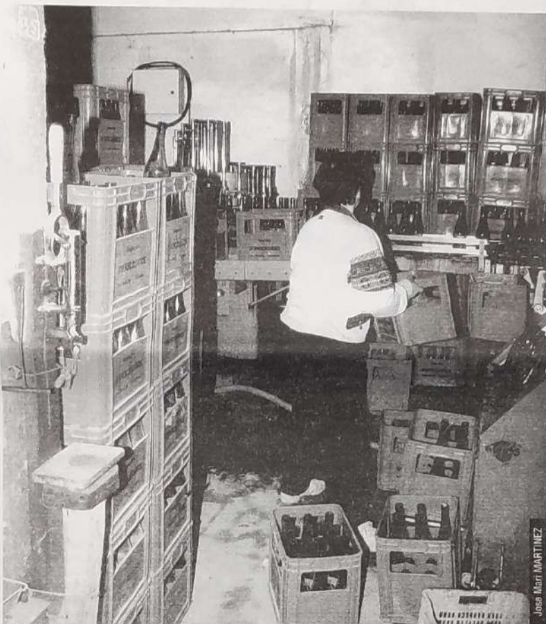
Sagardoa merkaturatzeko baliabide berrien bila dabilta sagardogileak.

Sektorearen lan nagusia hauxe da, kalitate oneko produktua lortzea, egonkorra, presentzia onekoa; azken batean, produktua duintzea.