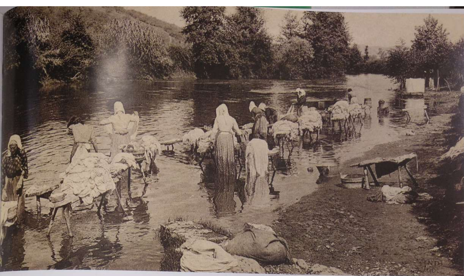
Gipuzkoara etortzen ziren bidaiariei atentzioa gehien ematen zien lanbidea Urumea ibaiko latsariena zen

raian ezagutzen den lehendabiziko garraio publikoarekin (gabarrariarena): bidaiarien itsasontziak pertsonak ibaiaren ertz batetik bestera pasatzeko funtzioa betetzen zuen. Erakusketa honetan, Zaragozako artxiboan aurkitutako plano bat jarri dugu; bertan, bidaiarien itsasontzia eta XVI. mendeko bidariaren kokalekua ikusi daitezke.