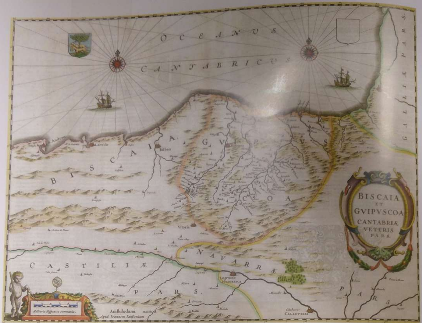
XVII. mendeko Gipuzkoako mapa