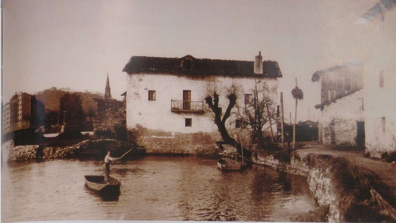
Gabarraria Urumea ibaiko Donostiako pasabideko portu batean