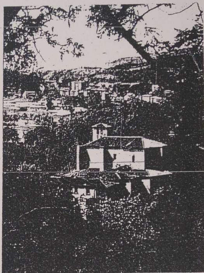
La iglesia de la Ascensión de Astigarraga, desde la subida a Santiagomendi.

No quiero indicaros ningún establecimiento concreto porque citarlos todos