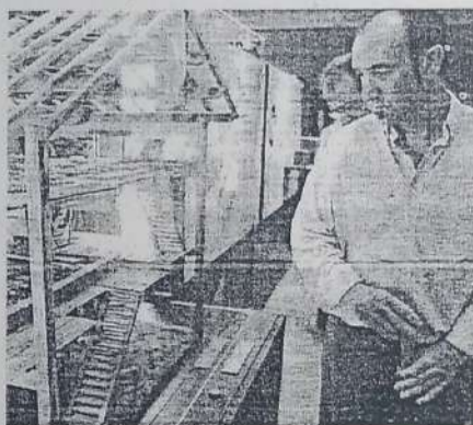
Museoan dolare baten maketa ikusi daiteke.