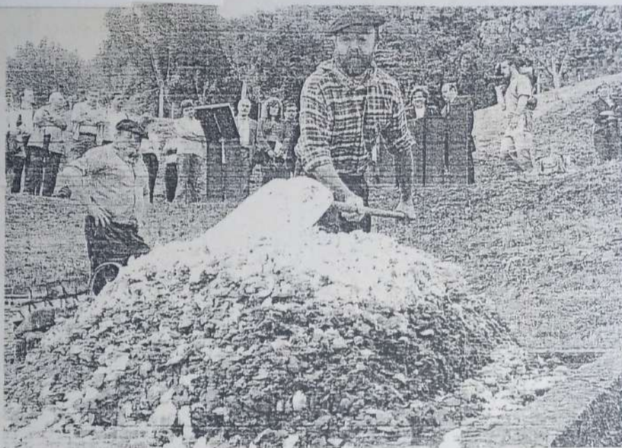
Sagardoetxe gidariak sagarrak eskuz zatitu eta pilatzen, aintzinean egiten zen bezala.

Lodoaren froga egiteko, sagastian sagarrondo mota autoktono guztietako aleen artean aukera daiteke. Euskal Herrian lanitzen diren motetaz aparte, historian zehar erabili diren laborantza teknikak ere erreproduzitu nahi izan dira museoan. usadiozkoekin hasi eta “horma-frutal” modernora iritsi arte. Duela 2.000 urte erabiltzen zizuten dolareen bezalako bat ere eraiki egin dute, egurra eta harria soilik erabiliz, metalik gabe. “Horretako batekin sagarren zukuaren %50 bakarrik ateratzen