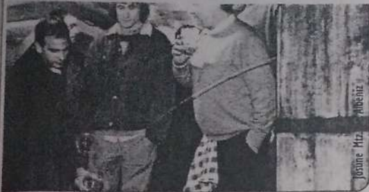
da nahiko sagar lantzen, eta falta dena kanpotik ekartzen dugu".