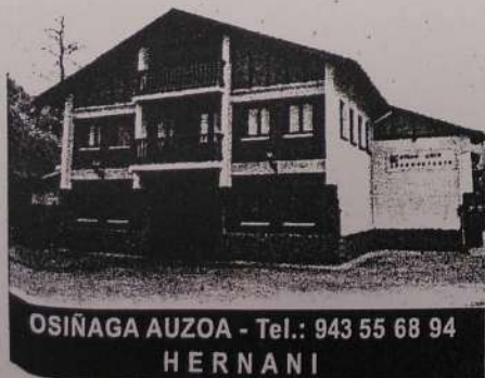
OSIÑAGA AUZOA - Tel.: 943 55 68 94 HERNANI

⊕ Sagardoa, berez Euskal Herriko edari tradizionaltzat jotzen dugu gutariko askok. Eta gipuzkoarrek, are gehiago. Nor ez da joan kanpotik bisitan etorritako lagunekin sagardotegi batera afaltzera? Gure ohituren isla baten moduan ikusi izan