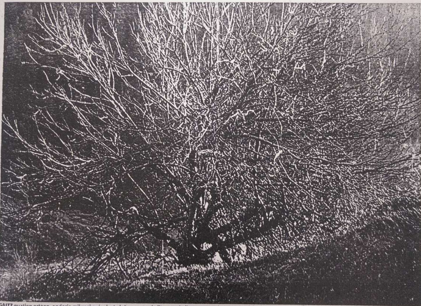
GAITZ guztien artean, ondorio mikroskopioak eta kripogamoak dituztenak dira sagarrondoentzat kaltegarrienak. BERRIA

69 gaitz desberdin identifikatuta dauden arren, 12 baino ez dira, benetan sagastiei eragiten dietenak eta horien artean ondo mikroskopikoek eta kripogamoak eragiten dituztenak dira kaltegarrienak. Gaitz guzti hauek identifikatu dituzten