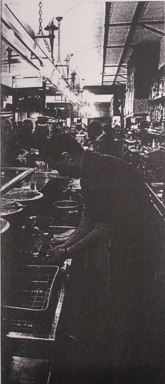
gardotegian, Iruñean.