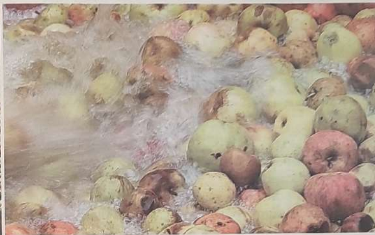
|| Gurutzeta sagardotegiko ataria sagarrez beteta dago asteotan. Urarekin garbitzen dituzte bertan, tolarera pasatu aurretik.