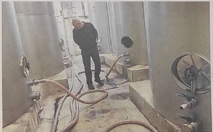
|| Gertutik zaintzen ditu sagardo upelak Gurutzetako nagusiak.

gar bila sagardogileek. Galiziatik eta Britainiatik ekarri dute gehiena, uzta oparoa izan baitute bi tokiotan. Asturistik ere iritsi dira sagarrak, baina beste urteetan baino gutxiago, han ere izan baitu eragina lehorteak. Kontuak kontu, behar adina sagar lortu dutela esan dute sagardogileek, eta hori omen da garrantzitsuen.