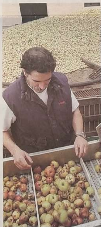
|| Sagarrak garbitu eta hautatzen.

Oraindik ez da uera hori iritsi, eta nabari da