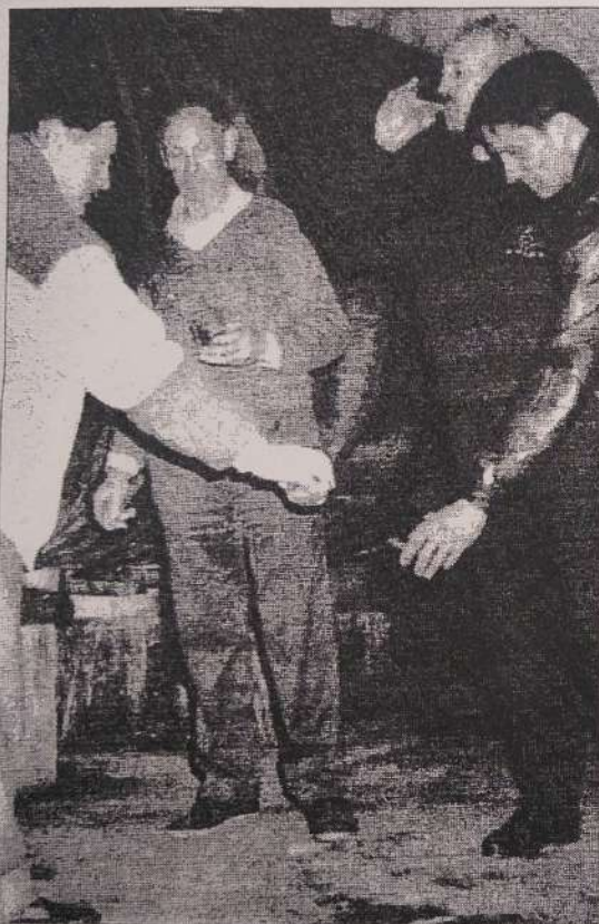
Zizarristas es el término con el que se denomina a los sagardozales.

La publicación "Euskal-erriaren Alde" recoge en 1914 un artículo de Vicente Laffitte Obineta (Donostia 1859-1944) que interrelacionaba sidra con alcoholismo y alienismo.