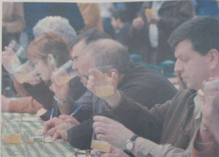
Sagarrondotik saioaren programazioaren barruan antolatutako sagardo lehiaketa.

Dagoeneko guztia dute prestatuta antolatzaileek laugarren edizioarako, datorren martxoaren 17, 18 eta 19a, hain zuzen ere, egun nagusiak izango dituen Sagarrondotik 2006rako. Sagardoaren bueltan hiru egun horietan jende andana bilduko den arren, Sagarrondotik egitasmoa urte osoan zehar antolatzen diren ekitaldiez josten da. Horrela, Donostia Eguna igarotzearekin bat egingo da aurkezpen ofiziala, euskal musikan ezinbesteko erreferentzia bilakatu den Benito Lertxundi musikariaren emanaldiaz gozatzeko aukera