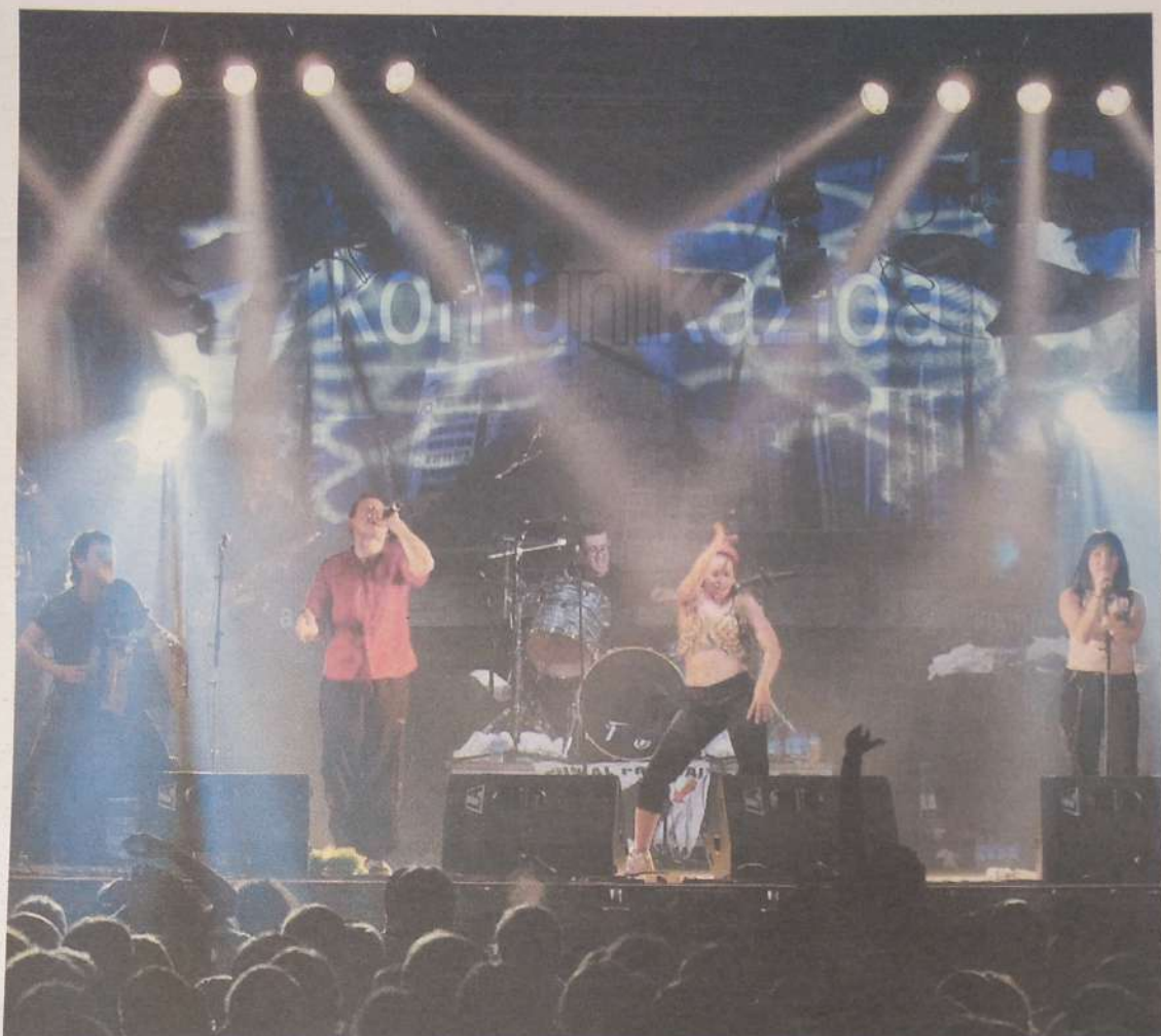
Kontzertuak dira sagardoaren inguruan antolatutako festaren beste ezaugarrietako bat.

du ziren Sagardo Mostra hartan elkartutako jendetzak baieztatu zuen hori lehen urtetik. Profesionalen arteko pilota partida ikusgarriak, Sagardo Eguna, Nafarroa, Bizkaia, Araba eta Gipuzkoako artisauen eta produktuen azoka, herri kirolak, herri bazkari mundiala, haurrentzako emanaldiak, folk kontzertuak... Indartsu etortzen da urtero Sagarrondotik eta indartsu erantzuten dio jendeak urtero egingandako eskaintzari.