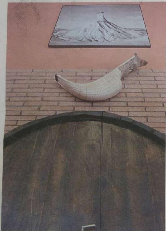
UPELA ☉ Upel bat Bardeko irudiaren eta xistera baten azpian, Valtierrako Bornax sagardotegian.

Valtierra inguruko poligono batean, mendi artean, menu tradizionalaz, sagardo naturalaz eta bestelako berezitasunez gozaten ahal da, Bornax sagardotegian