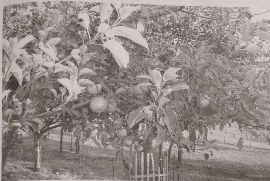
La cosecha de manzana autóctona ha sido de las mejores de los últimos años.

Con una materia prima de calidad y la ayuda de la climatología se confía en que sea un buen año sidrero.