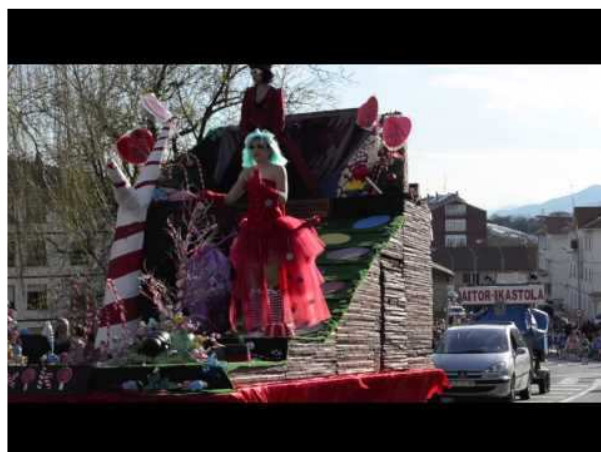
Altzako Eltze festa