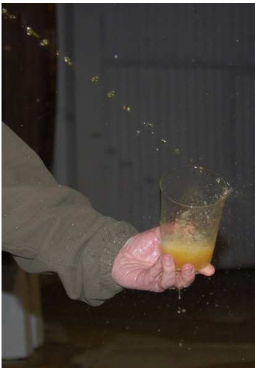
Txotx denboraldia hasi da.

Donostia sagardotegien erresuma zen joan den mendearen hasieran; 1931. urtean, hirian 99 sagardotegi zeuden eta Altzan, 47.