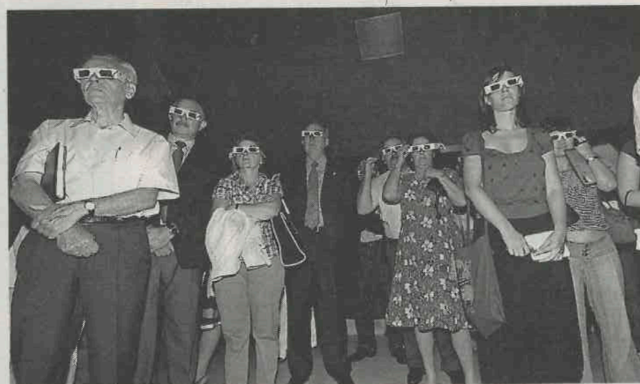
Una película en 3D explicará cómo se fabrica un lagar. [APREA]

El caserío de Ezkio-Itsaso se abrirá al público reconvertido en museo y centro de interpretación