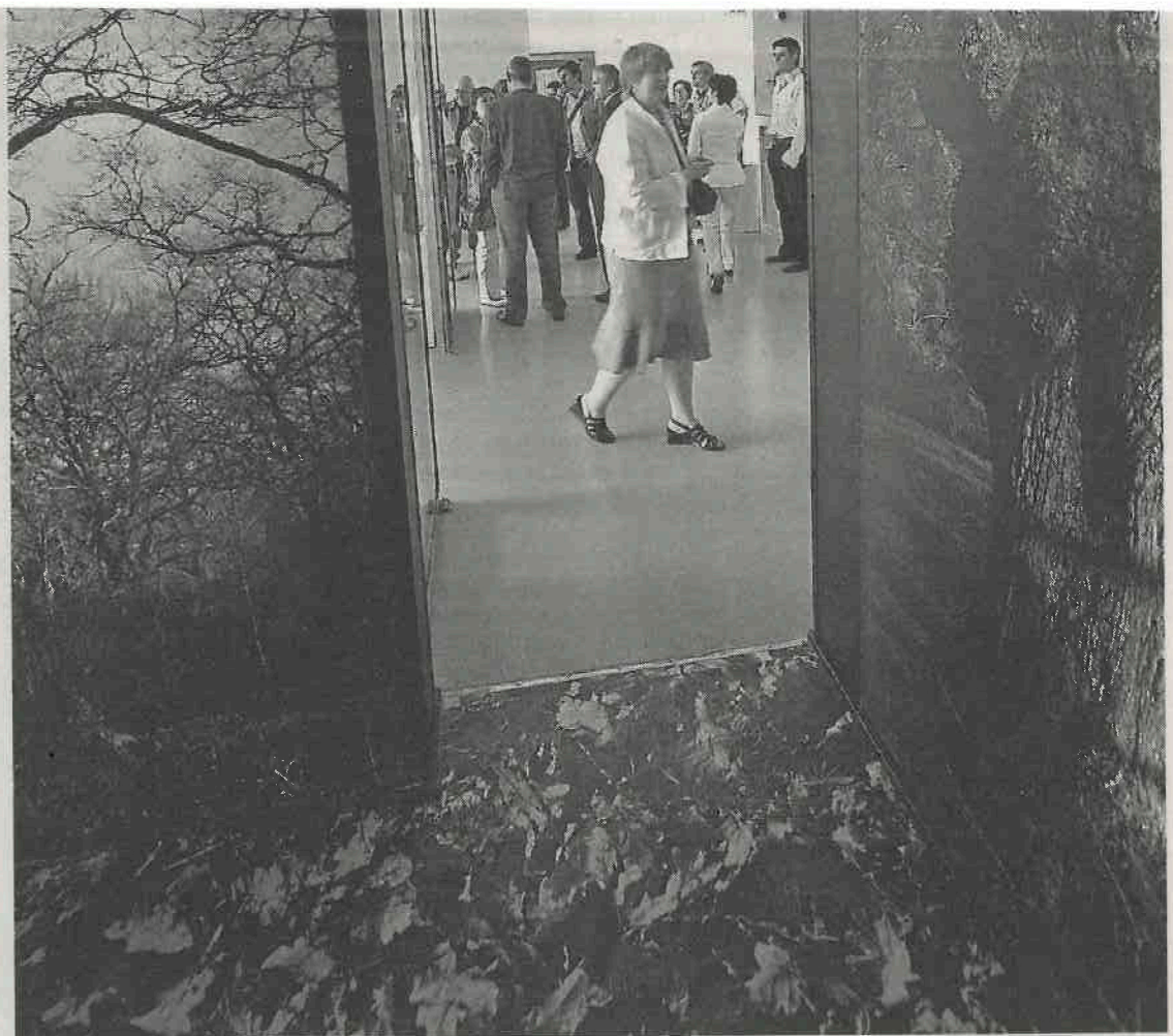
El nuevo Centro de Interpretación explica la historia de los caseríos con nuevas tecnologías.