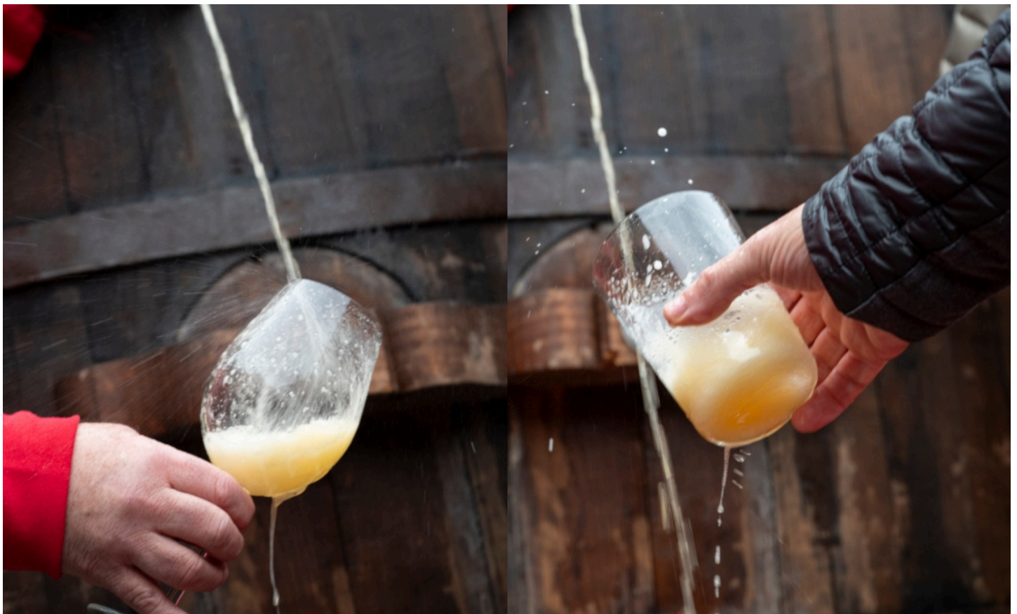
Kopa bat eta edalontzi bat, atzoko txotx garaiaren aurkezpenean.

Kopan zein basoan dastatu zuten atzo aurtengo sagardoa, Donostian.