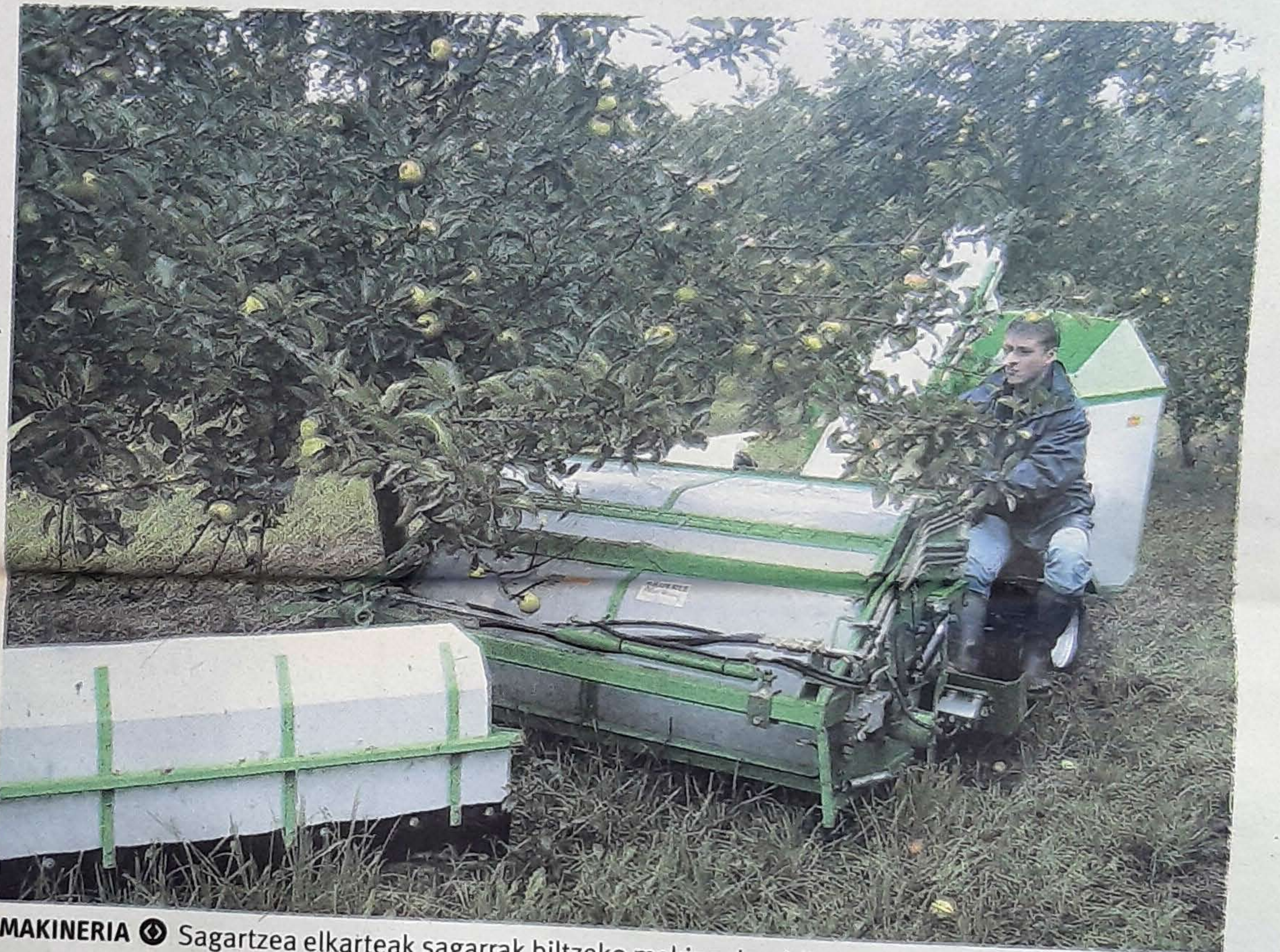
MAKINERIA Sagartzea elkarteak sagarrak biltzeko makina darabil. HARTZEA LOPEZ DE ARANA

Lapurdikoa, Nafarroa Behereko eta Zuberoako sagardotegiek 65.000 litro produzitu dituzte