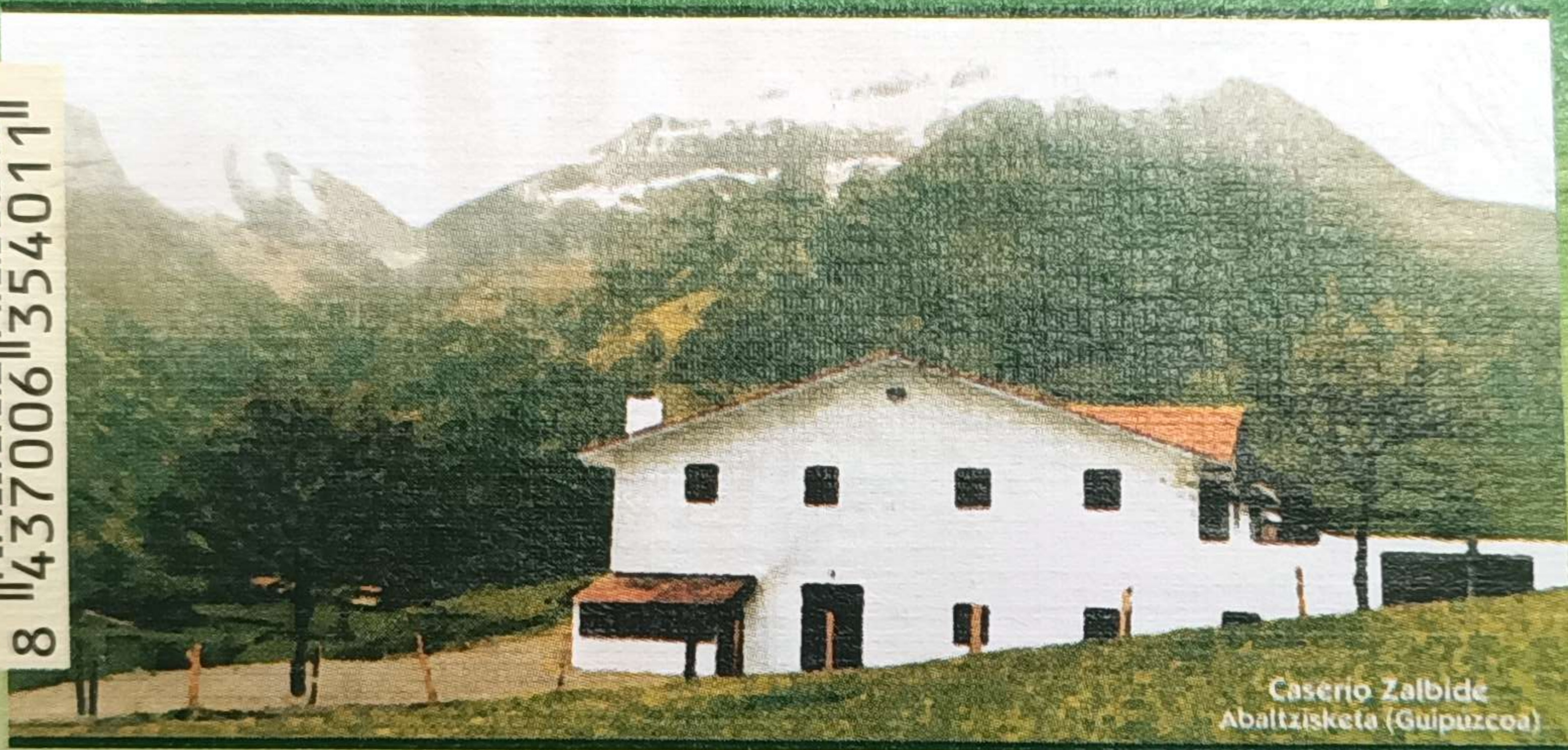
Caserio Zalbide Abaltzisketa (Guipuzcoa)