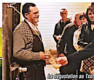
La dégustation au Txotx

Ouvert à l'année, entrée libre. Groupes sur RDV, nous consulter