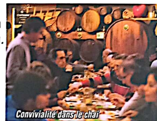
Convivialité dans le chai

Ouvert à l'année du Jeudi midi au Dimanche midi et Lundi soir De Juillet à Septembre et durant les vacances scolaires : ouvert tous les jours, midi et soir Toutes autres possibilités sur réservation pour groupes.