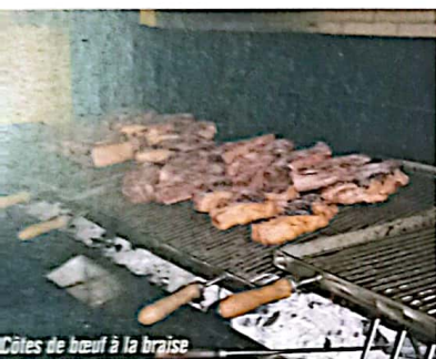
Côtes de boeuf à la braise