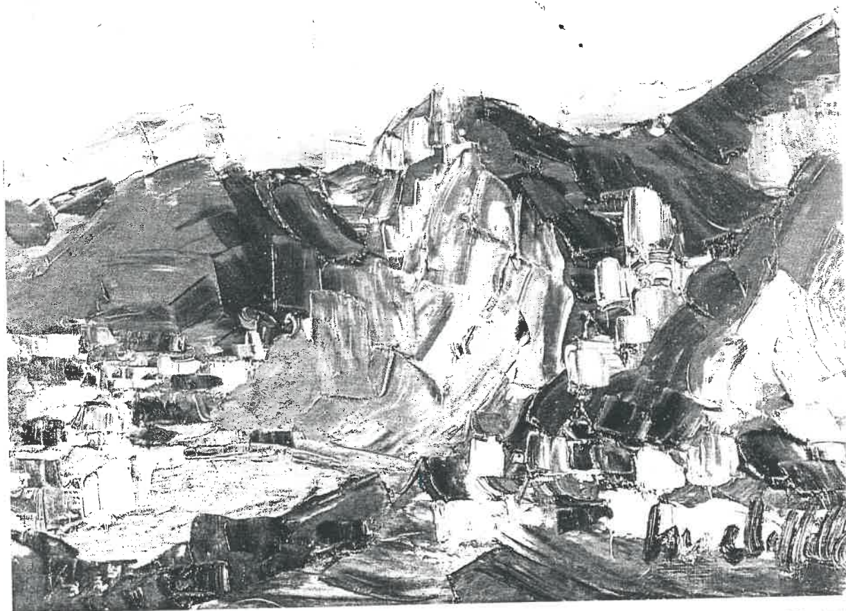
“Chateau Falkenstein” (Suiza), obra de Irene Laffitte Mesa