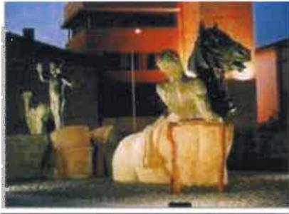
Monumento a la vendimia HARO