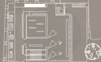
Planta 2. Enología. La bodega tradicional y la bodega moderna

Second floor: Oenology. Traditional and modern winery