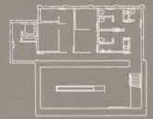
Sótano. El vino y los sentidos. Fundamentos de la cata

Second floor: Oenology. Traditional and modern winery