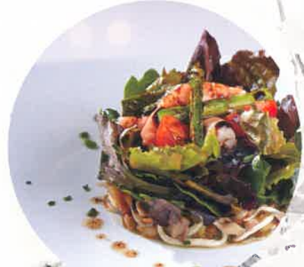
PRODUCTOS DE TEMPORADA