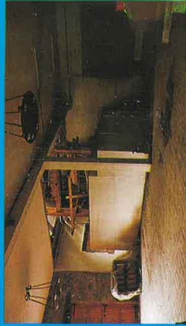
Lagar de Fraisoro

Simultaneando con este conjunto de trabajos expuestos en orden cronológico y cuyo seguimiento se practicará o se repetirá, según su naturaleza, en años sucesivos, Personal Técnico de la Diputación Foral, adscrito expresamente al programa reseñado, prestará a los baserritarras todo el asesoramiento que soliciten, organizará charlas localmente, publicará folletos explicativos y procurará que en todo momento los cultivadores de manzana para sidra estén informados de las innovaciones en la explotación de la manzana y de los resultados e informaciones que vayan procurando los trabajos más arriba expuestos.