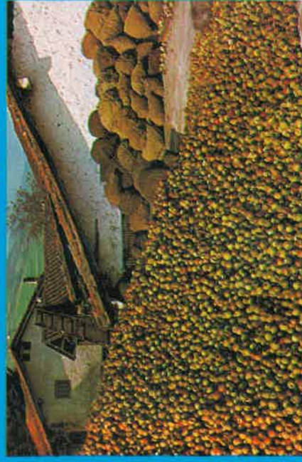
Antes de tritular

De todo este conjunto de frutas, sin lugar a dudas, es y ha sido la manzana la fruta reina y tradicional en nuestro País Vasco, no sólo por la antigüedad de su cultivo