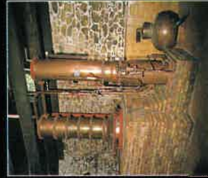
La distillerie familiale et son Musée de l'Ambic