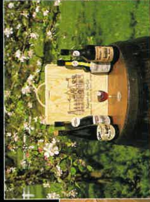
Le chais et les produits

Hervé SEZNEC ist der Erbe einer alten Familientradition und lädt Sie ein, Keller und Produkte des "Manoir du Kinkiz" zu entdecken, wo nach alter Art Apfelwein gekeltert wird. Ein Erzeuger lädt Sie ein, besichtigen Sie einen in der Bretagne einzigartigen Apfelwein Keller - Apfelweinproben - Direktverkauf - MO - SA von 9.30 / 12.30 und 14.00 / 18.30