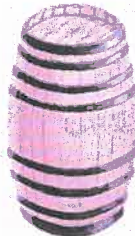
PORTUGUESA 540 LITROS VIENTRE : 2'30 MOLDE : 0'69 ALTURA : 1'355