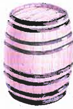
BOCOY 650 LITROS VIENTRE : 3'24 MOLDE : 0'82 ALTURA : 1'22