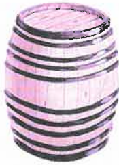
BOTA 1000 LITROS VIENTRE : 3'77 MOLDE : 0'97 ALTURA : 1'355

Forma eta neurrien arabera, upelek izen bereziak dituzte; hona hemen egurrezko upel arruntenak eta gure arteko ezagunenak: (Olariagaren bertsioa, hiztegiaren marrazkia?)