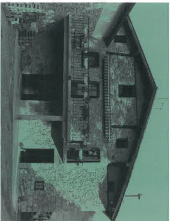
Txorioketeta Bidea13 /Astigarraga (Guzpuzkoa) / 943 55 15 27 / astalbesagardotegia.com

Sagar mutzuak kuplean egindako irakinetik lortutako edaria.