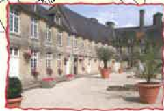
Le Musée de l'Eau-de-Vie et des Vieux Métiers

Musée Régional du Cidre Rue du Petit Versailles Tél. : 02.33.40.22.73