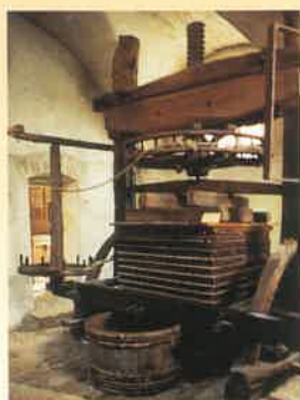
Pressoir à rouet dit "ponceux"

Bâtie vers 1480 à usage de teinturerie pour draps de laine, cuirs et peaux, cette maison a ensuite servi de caserne de 1733 à la fin du 19 e siècle. Vous découvrirez 5 siècles d'histoire du cidre à travers broyeurs et pressoirs, poteries, matériels de transport et scènes de la vie normande avec costumes et meubles des 18 e et 19 e siècles.