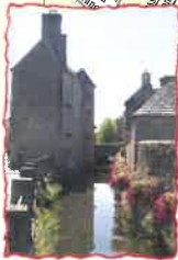
Le Musée du Cidre