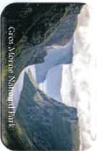
Gros Morne National Park