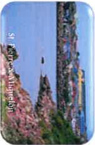
St. Pierre & Miquelon