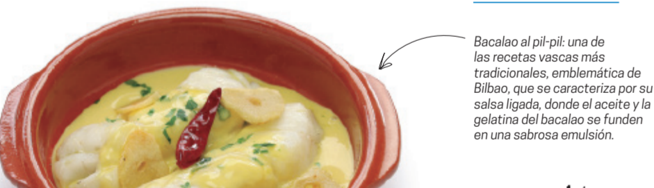
Bacalao al pil-pil, una de las recetas vascas más tradicionales, emblemática de Bilbao, que se caracteriza por su salsa ligada, donde el aceite y la gelatina del bacalao se funden en una sabrosa emulsión.