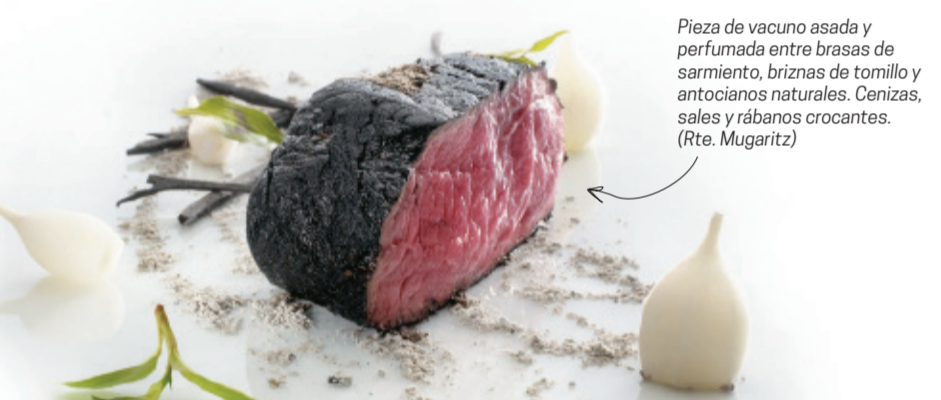
Pieza de vacuno asada y perfumada entre brasas de sarmiento, brinzas de tomillo y antocianos naturales. Cenizas, sales y rábanos crocantes. (Rte. Mugaritz)

Pero no sólo es exigente el comensal. Los cocineros vascos son conscientes de su papel como trasmisores de esa tradición, y no dejan de evolucionar y sorprender con nuevas creaciones, alcanzando unas cotas de excelencia impresionantes. De hecho, la mitad de los restaurantes con tres Estrellas de la prestigiosa guía Michelin que hay en el Estado están en Euskadi. En total son 33 Estrellas Michelin repartidas en 24 restaurantes vascos. San Sebastián, por ejemplo, es la ciudad con más Estrellas por habitante del mundo; a 10 minutos en coche podemos encontrar 16 Estrellas Michelin... Además, 3 restaurantes vascos están en el top 20 de "The world's 50 best Restaurants" , una de las listas más exigentes y prestigiosas de todo el mundo a la hora de evaluar la calidad de los restaurantes.