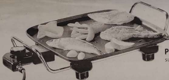
PRINCESS sukaldeko plantxa

Ezagutu BERRIAREN harpidedun izatearen abantailak: