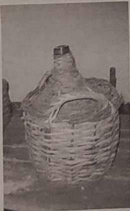
Muntoko saskiak eta ardo-txanbilak daude Katxolan. RAUL PEREZ