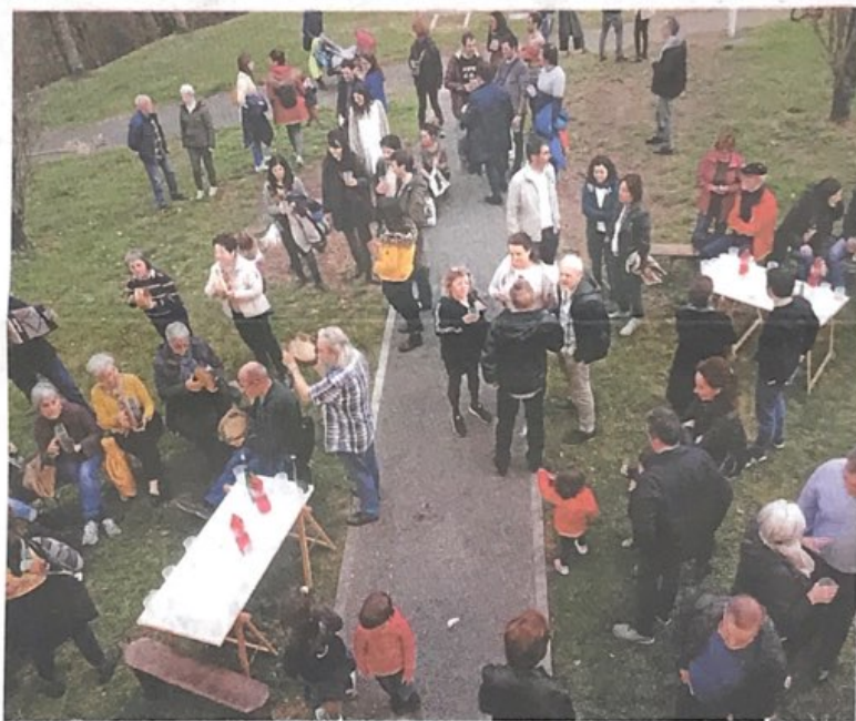
Ambiente en el exterior del caserío Katzola durante la jornada dedicada a la sidra.

Con ocasión del txotx el caserío Katzola se realizó una actividad especial en relación al mundo escolar: el 50 aniversario de Axular Lizeoa. La ikastola empezó con siete alumnos en la parroquia Gurutzetza y en la actualidad cuenta en su centro con 898 estudiantes.