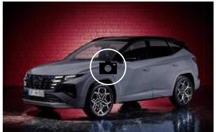
📷 Fotogalería: Hyundai Tucson N-Line