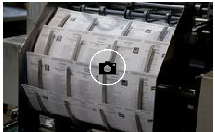
📷 Las papeletas fabricadas en Pasaia que decidirán el futuro Govern