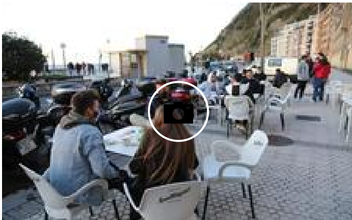
📷 La hostelería, preparada para reabrir