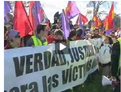
Tensión en el Valle de los Caídos