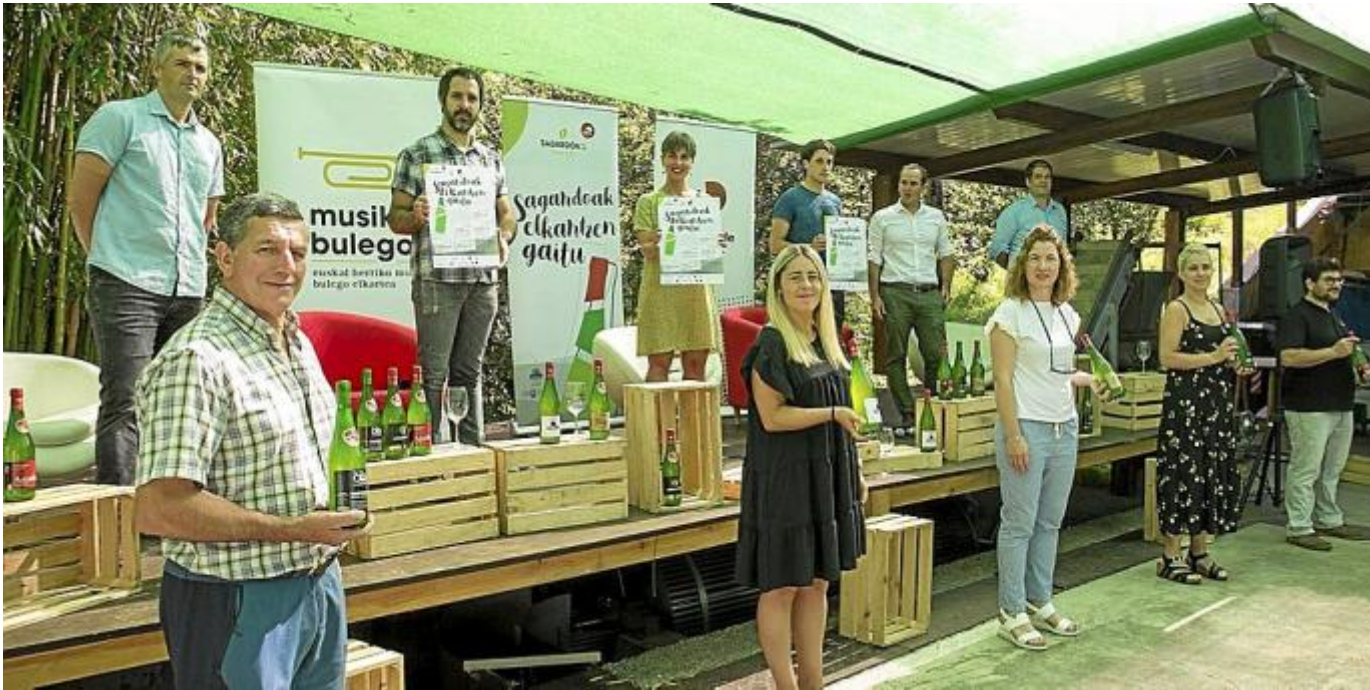
Representantes de las sidrerías, Musika Bulegoa y bertsolaris, en la presentación de ayer en Astigarraga.

JON ANDER PÉREZ / IKER AZURMENDI | 09.07.2020 | 00:57