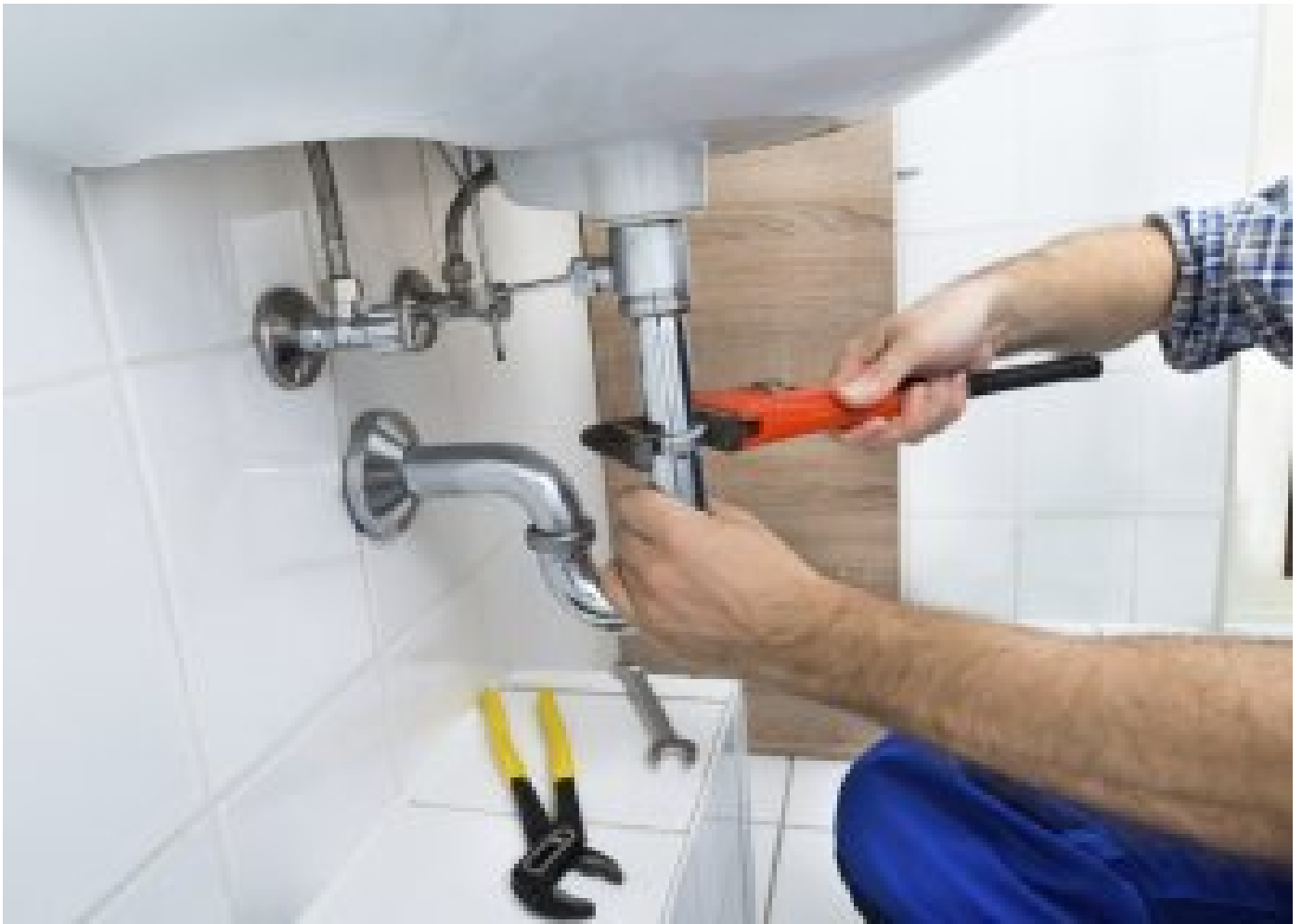
Este curioso seguro de hogar está revolucionando el mercado ¡Desde 55 € / año!