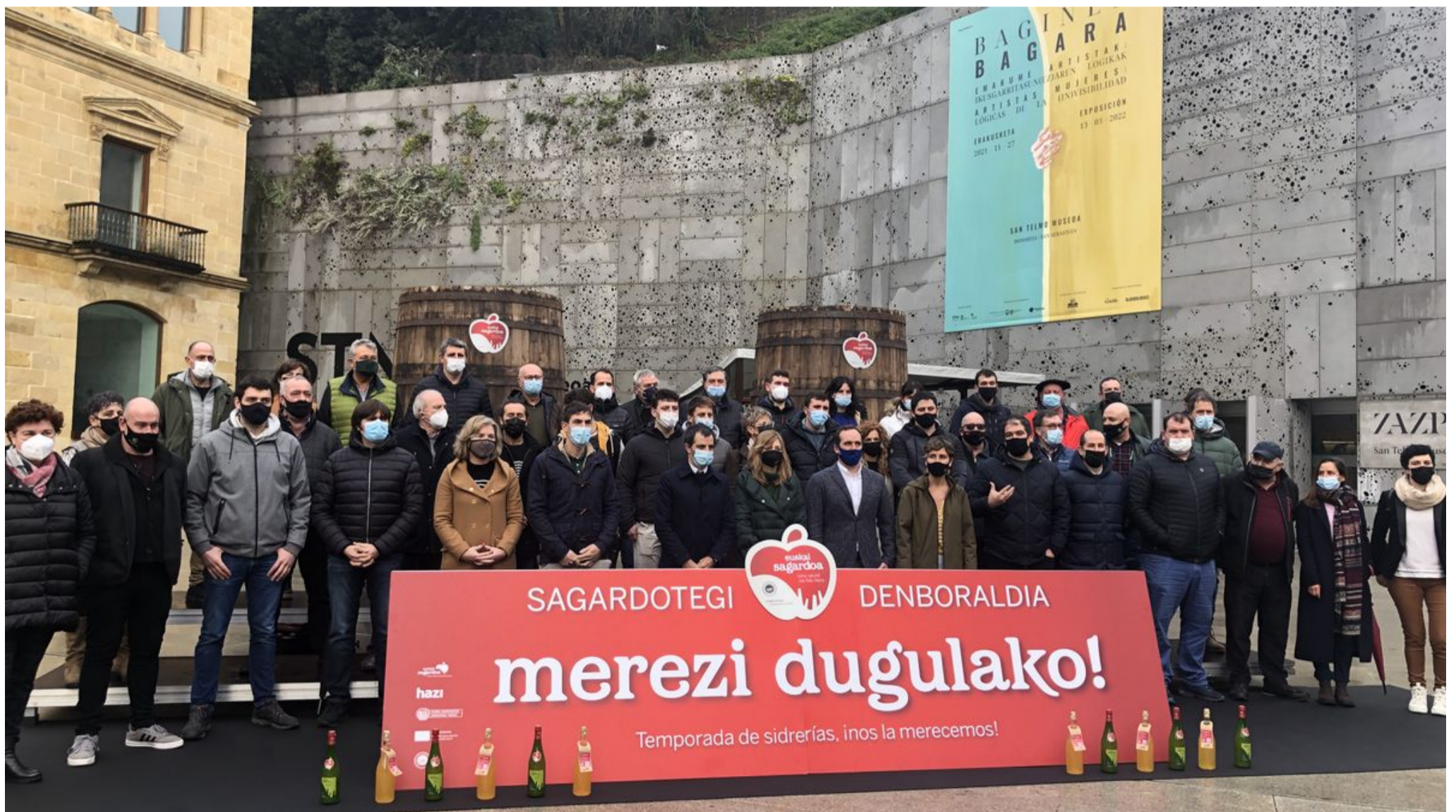
Representantes de las sidrerías de Euskadi en la presentación de la nueva temporada de sidrerías