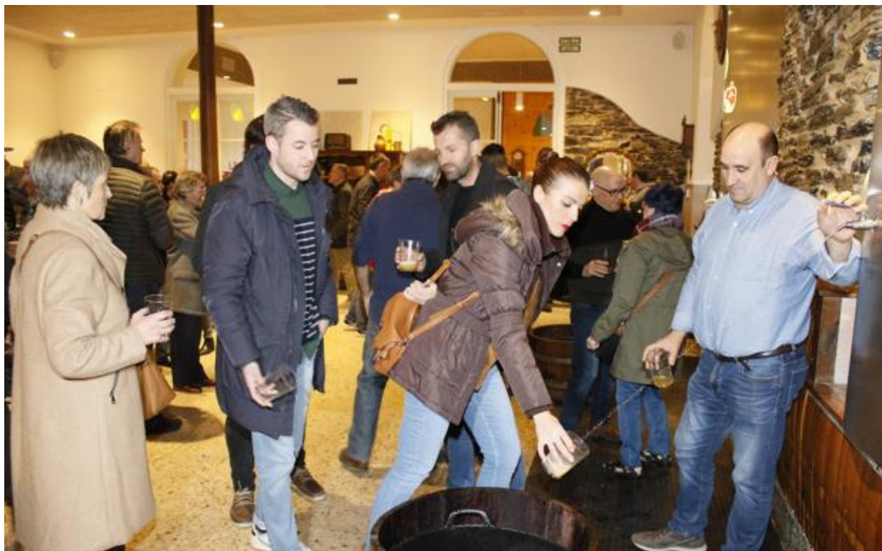
Apertura del 'txotx' 2020 en la Sidrería Kuartango.

Ya acumulan reservas para los próximos fines de semana y aunque dan el año por «perdido» confían en seguir llenando en verano