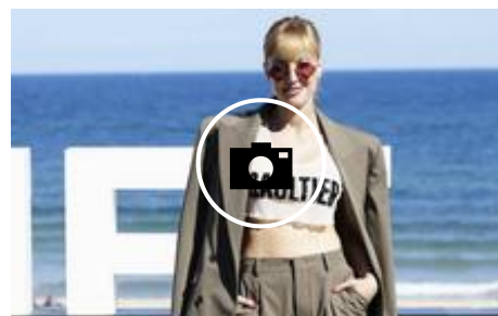
📷 Los looks de las actrices del Zinemaldia triunfan día y noche