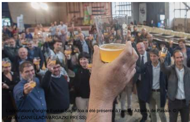
L'appellation d'origine Euskal Sagardoa a été présentée à l'atelier Albaola de Pasaia.

MEDIABASK | 2017/06/07 13:25 | 0 IRUZKIN