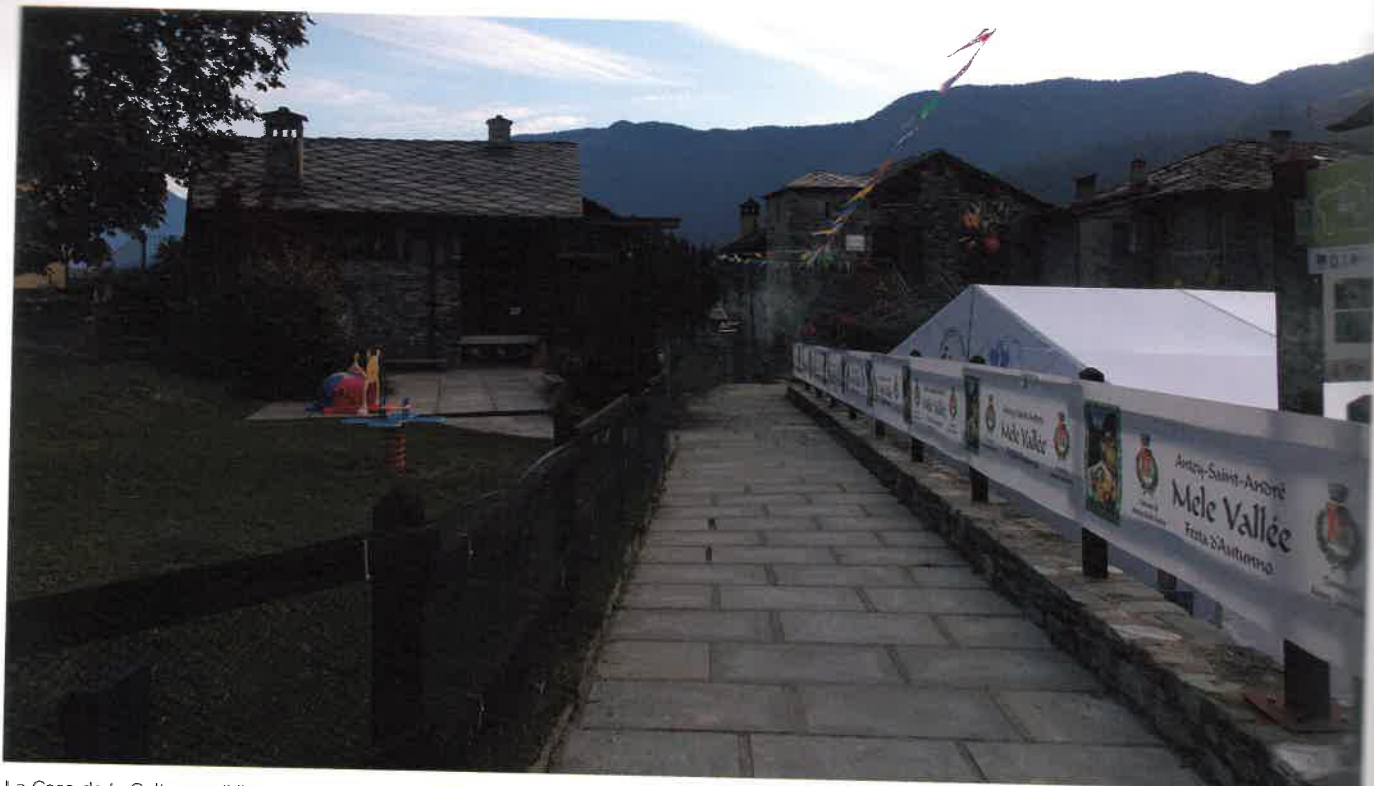
La Casa de la Cultura ye'l llugar dedicáu a les conferencies.

A lo largo de dos días, el fin de semana del sábado 7 y el domingo 8 de octubre, el casco antiguo del pueblo de Antey-Saint-André vuelve a acoger las actividades de la fiesta y el mercado agrícola y artesano de Mele Vallée, un festival centrado en el tema de la manzana y la sidra, no en vano el Valle