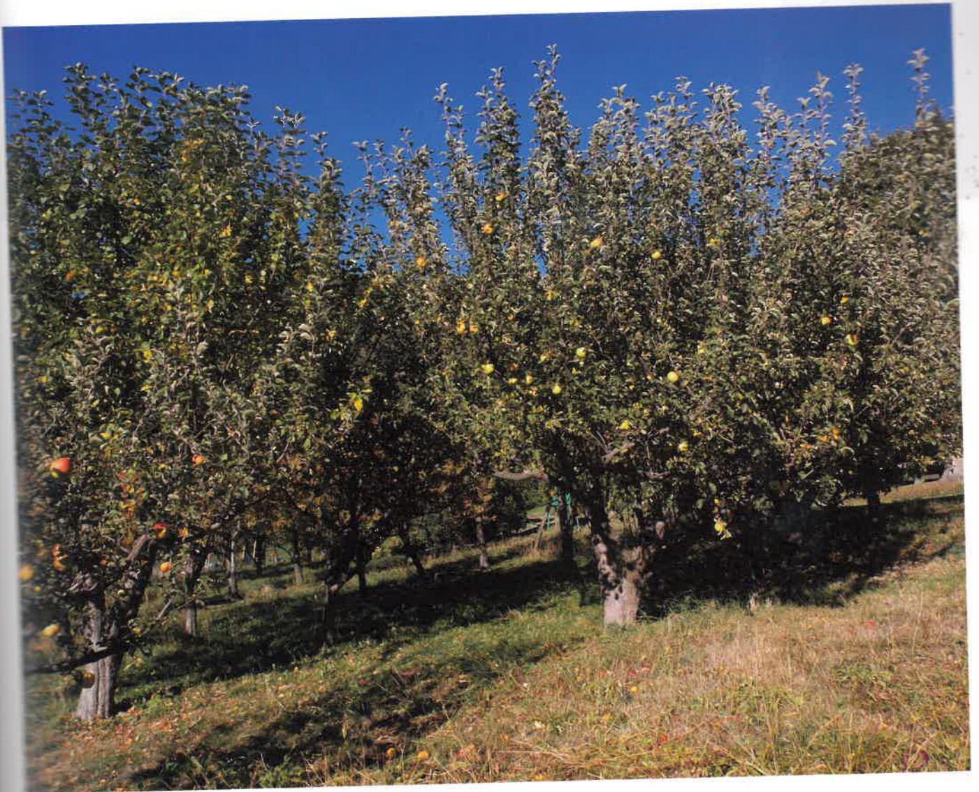
Manzanas en la ladera de los Alpes.

Y es que también las actividades programadas para esos días son variadas y muy numerosas, pues además del mercado que le da nombre a la fiesta, cuenta con animaciones infantiles, exposiciones, iniciativas gastronómicas centradas en la manzana, encuentros con representaciones de otros municipios italianos y europeos con los que Aoste-Saint-André se encuentra hermanado, conferencias sobre el sector de la sidra y presentaciones, degustaciones y venta de sidra tanto de Italia como de otros países europeos.