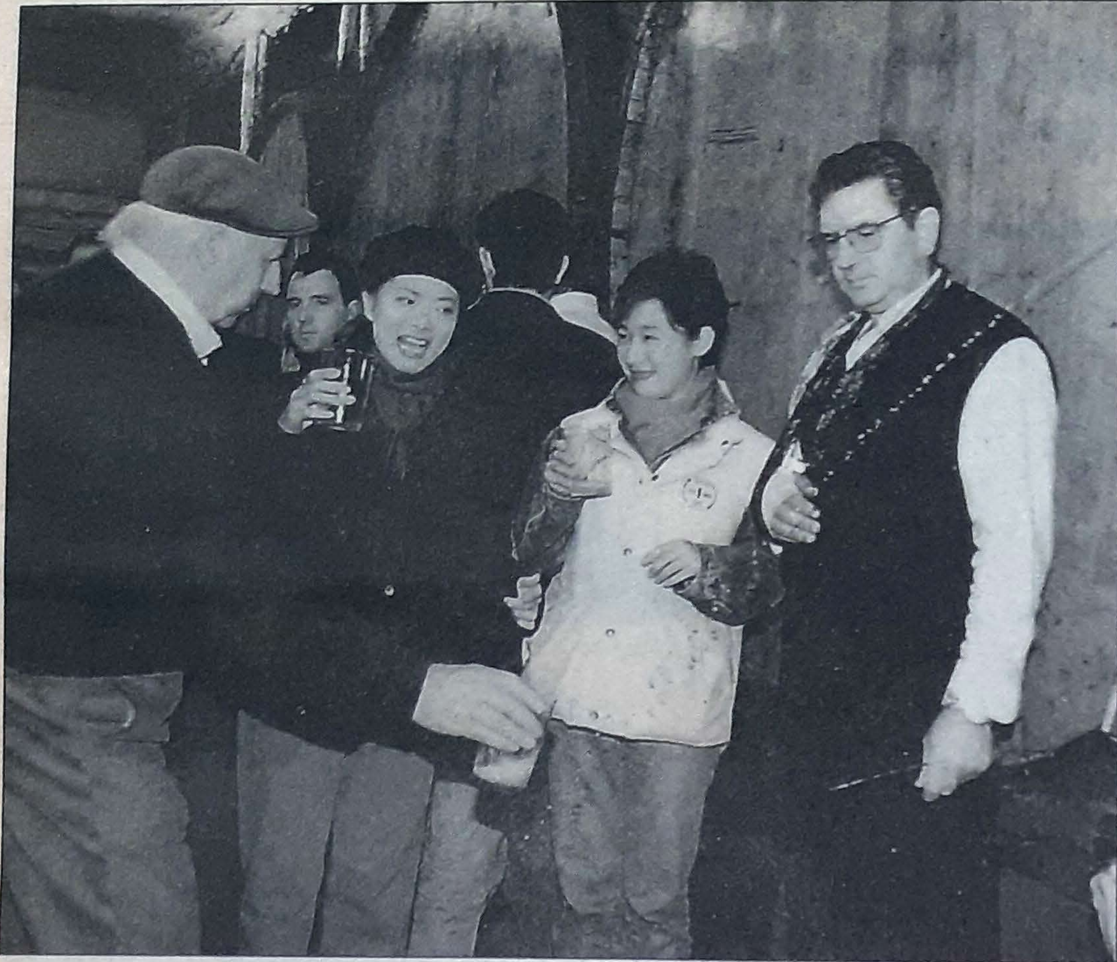
Reporteras de una TV coreana en la apertura de temporada en Astigarraga.

La apertura de las sidrerías Txertakadi, en Zaldibia, y Otatza, en Zerain, viene a confirmar un despegue sidrero de la comarca del Goierri. Anteriormente, a la histórica de Ikaztegieta se le habían sumado las de Legorreta, Amezketeta, Ataun y Abaltzisketa