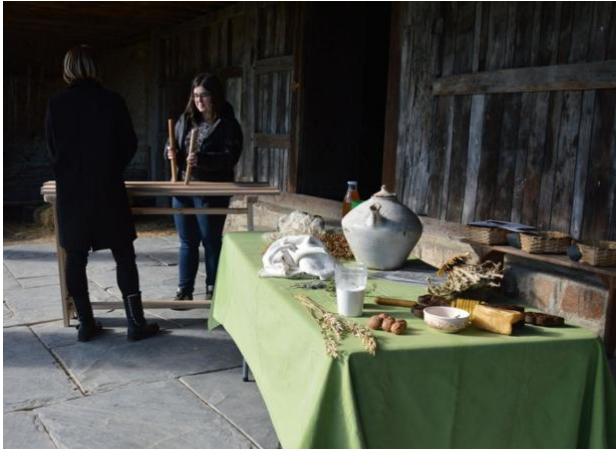
Igartubeiti baserriko atarian.

Patrim sareak koproduzitutako egitasmoa da hau. Igartubeiti sare honetako partaide da